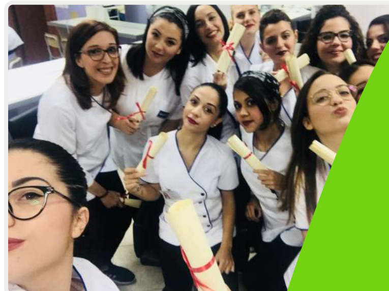
Nelle foto alcuni momenti della consegna degli attestati di qualifica professionale nelle sedi Euroform della Sicilia

Operatore del Benessere (Acconciatore / Estetica); Operatore della Trasformazione Agroalimentare (Pasticciere / Panettiere-Pizzaiolo); Operatore alla Riparazione dei Veicoli a Motore (Rip. parti e sistemi meccanici ed elettromeccanici del veicolo); Operatore dell'Abbigliamento (Stilista / Sartoria); Operatore del Montaggio e della Manutenzione di Imbarcazioni da Diporto (Riparatore e Manutentore di barche a vela e a motore); Operatore ai Servizi di Promozione ed Accoglienza Turistica (Addetto ai Servizi Ricettivi / Addetto d'Agenzia Turistica); Operatore della Ristorazione (Cuoco/Preparazione pasti/Assistente di sala, Barman); Operatore Elettronico (Istallaz. e Ripar. Sistemi Elettr., Reti Informatiche e Impianti Telefonici); Operatore Agricolo (Capo Azienda/Viticoltore/Servizi per l'Agricoltura).