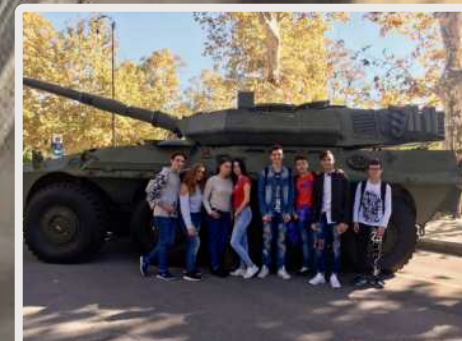
I ragazzi dell'Euroform celebrano le Forze Armate e l'Unità Nazionale.