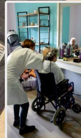
Gli studenti curano il look degli anziani nelle case di riposo.