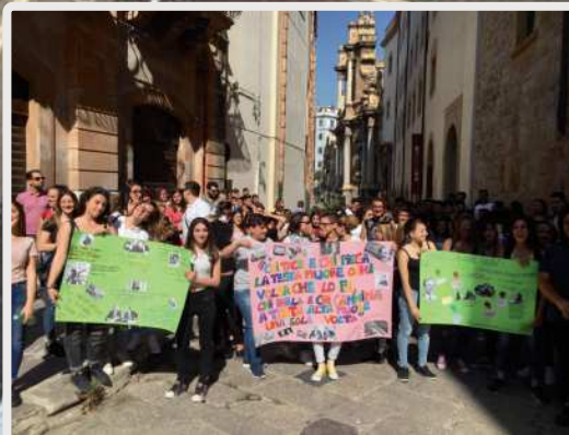
In occasione della giornata della legalità, gli studenti dell'Euroform sono scesi per strada, assieme ai docenti e ai tutor, nel ricordo dei magistrati Falcone e Borsellino e di tutte le vittime di mafia.