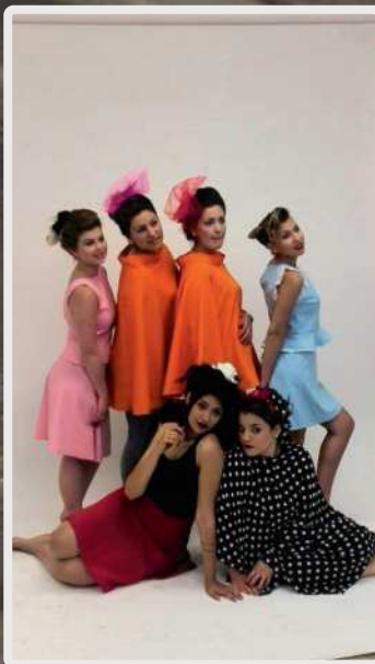
Shooting anni '50, ramo Operatore del Benessere.