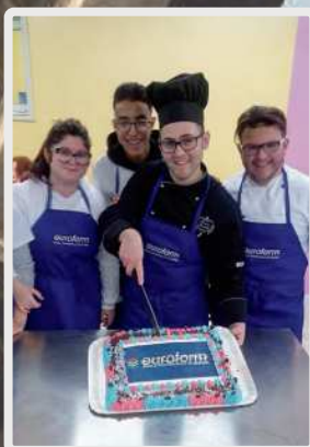
Un torta realizzata in laboratorio dagli studenti dell'indirizzo Operatore della Trasformazione Agroalimentare di Agrigento.